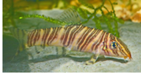
Botia striata (zebrasmerling; uoff. navn: sribet smerling)