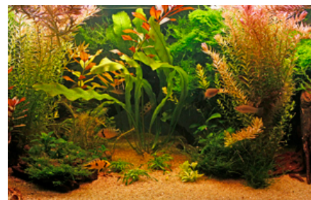
I det beplantede stueakvarium er det vigtigt, at fiskene har masser af både svømmeplads og skjul, samt mulighed for eventuel territorieafgrænsning og æglægning.

Akvariestørrelse: De mellemstore og store arter (ca. 8-13 cm) kræver generelt et akvarium på min. 250 L (min. 1 m i længden), men gerne større. De største arter (>13 cm) skal holdes i et mindst 325 L stort akvarium (min. 1,2 m i længden).