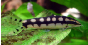
Ambastia sidthimunki (dværgsmerling; uoff. navne: dværgbotia, skakbrætsmerling)*