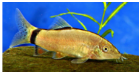
Yasuhikotakia morleti (musebotia)