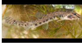
Cobitis taenia ((almindelig) pigsmerling)**