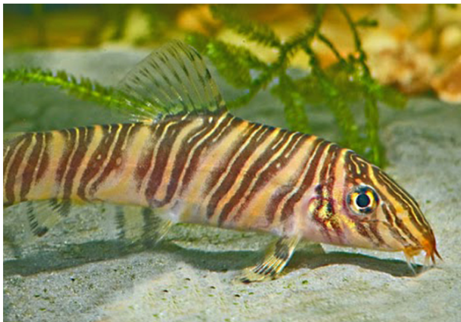
Zebra smerling ( Botia striata ), der også går under navnet stribet smerling, er en af over 1000 nulevende arter af smerlinger, der findes i naturen.